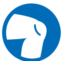
Knien und Bücken

In der Existenzschutzversicherung sind sämtliche der aufgeführten Grundfähigkeiten versichert. Bereits bei Verlust einer einzigen dieser Grundfähigkeiten wird die vereinbarte monatliche Rente bezahlt.