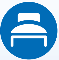
Beeinträchtigung als Folge von Pflegebedürftigkeit