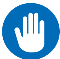
Gebrauch einer Hand