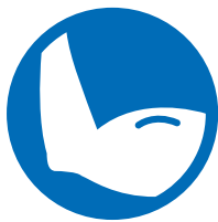
Gebrauch eines Arms

*Der Zahlbeitrag ist für das Kalenderjahr 2018 garantiert und gilt auch weiterhin, sofern nicht andere Überschussätze deklariert werden. Aufgrund Ihrer persönlichen Risikosituation kann sich der Beitrag ändern.